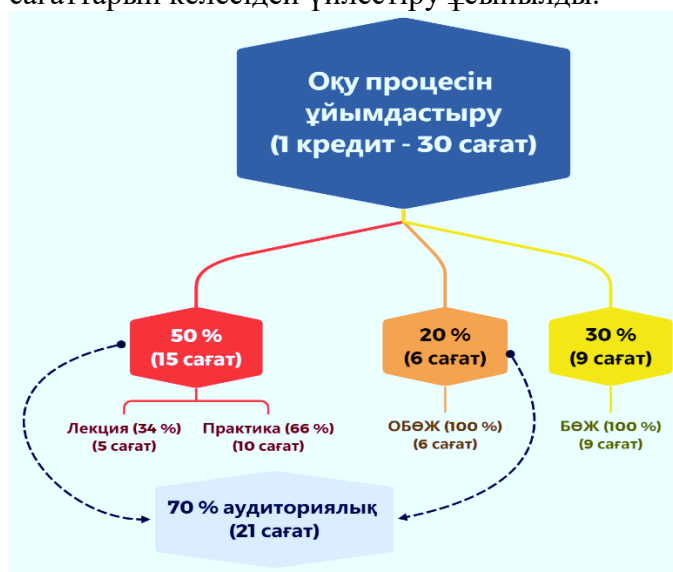
Сурет 3. Сабақтардың үйлесімі.

Сондай-ақ сабақтардың аудиториялық және білім алушылардың аудиториядан тыс сағаттарын келесідей үйлестіру ұсынылды.