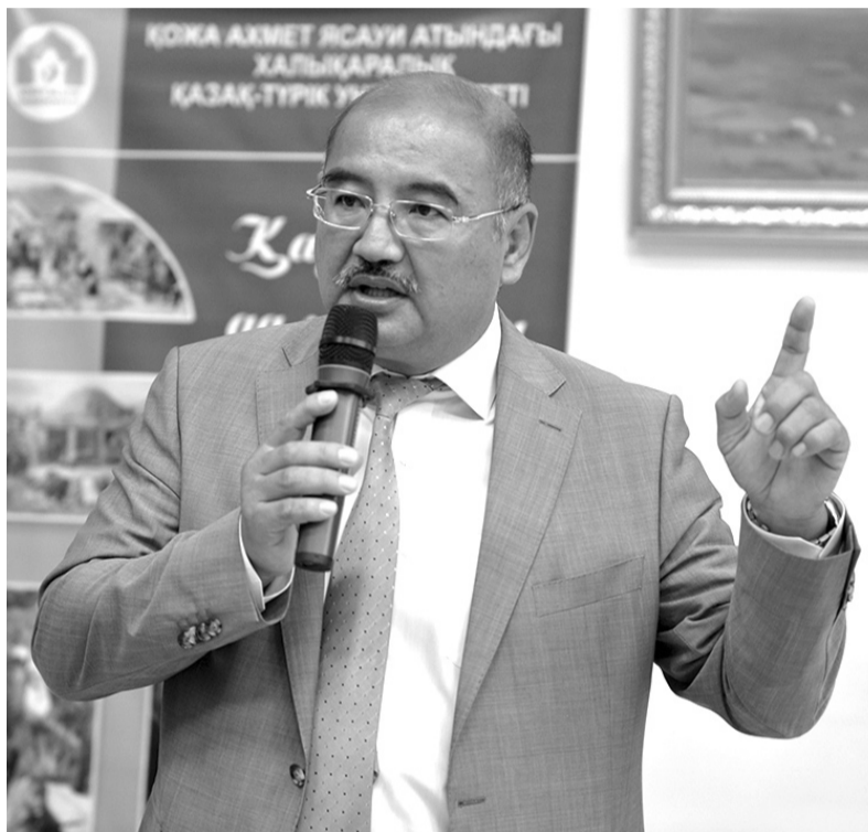
ҚҰРМЕТТІ ОҚИТУШЫ-ПРОФЕССОРЛАР МЕН ҚЫЗМЕТКЕРЛЕР! ҚЫМБАТТЫ СТУДЕНТТЕР!

Сіздерді Білім күнімен және жаңа оқу жылының басталуымен құттықтаймын! Баршаңызға жақсы көңіл-күй, жаңа жетістіктер мен шығармашылық ізденістер, мықты денсаулық және жаңа бастамаларда тек қана сәттіліктер тілеймін.