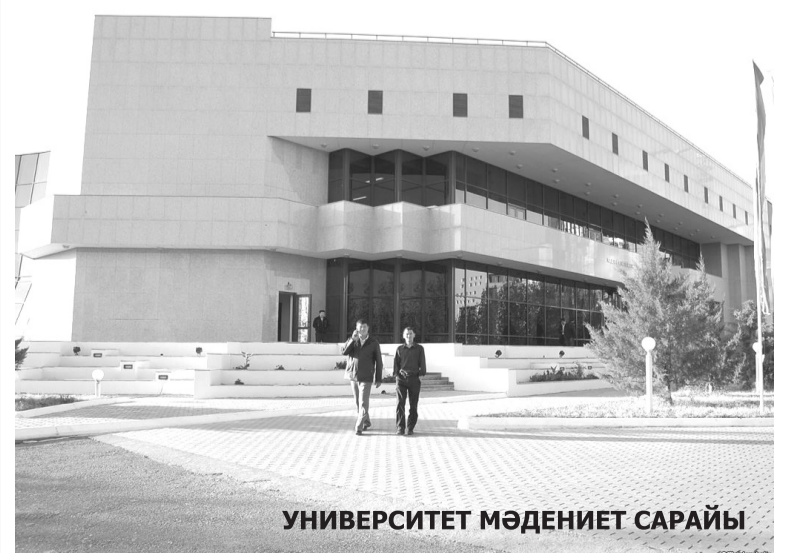
УНИВЕРСИТЕТ МӘДЕНИЕТ САРАЙЫ