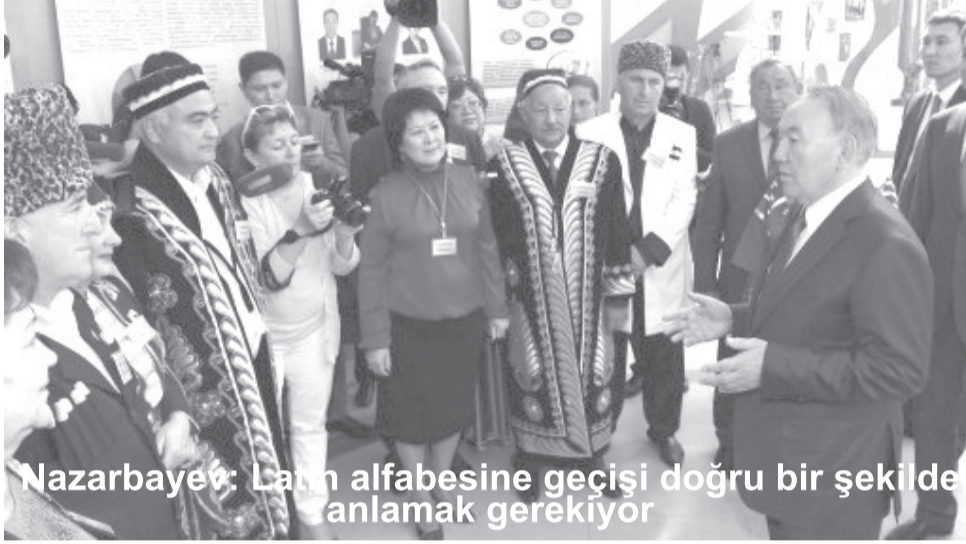
Nazarbayev: Latin alfabesine geçişi doğru bir şekilde anlamak gerekiyor

Kazakistan Cumhurbaşkanı Nursultan Nazarbayev, Jambul eyaletine gerçekleştirdiği çalışma ziyareti sırasında yaptığı açıklamada Kiril alfabesinden Kazakistan'ın Latin alfabesine geçmeye hazırlanmasını değerlendirdi.