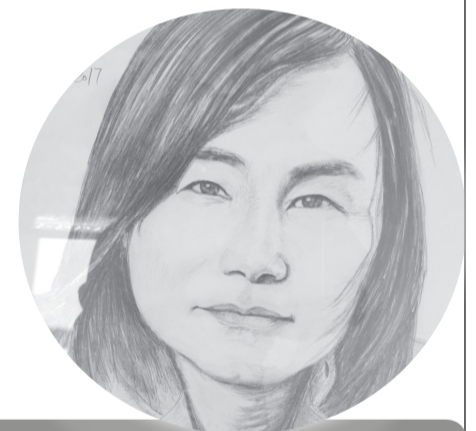
АРАЙДЫҢ СУРЕТ ӘЛЕМІ