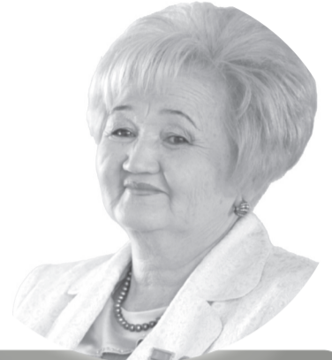
ОҚЫТУШЫ ШЕБЕРЛІГІН ШЫНДАУ МЕКТЕБІ