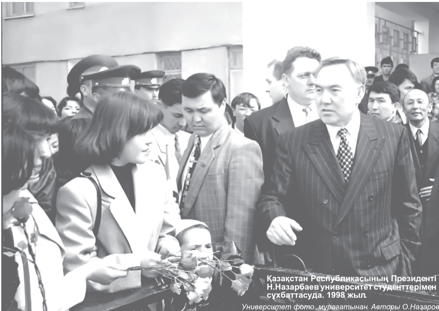
Қазақстан Республикасының Президенті Н.Назарбаев университет студенттерімен сұхбаттасуда. 1998 жыл.