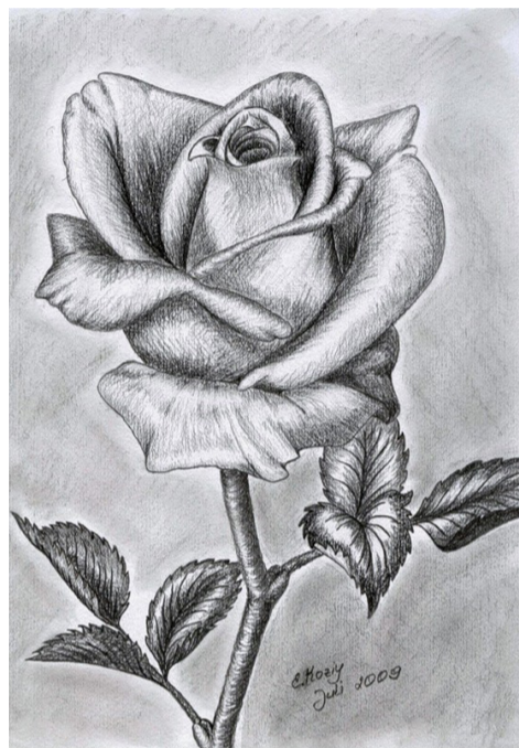
Марат ҚАНИ, III - курс студенті.