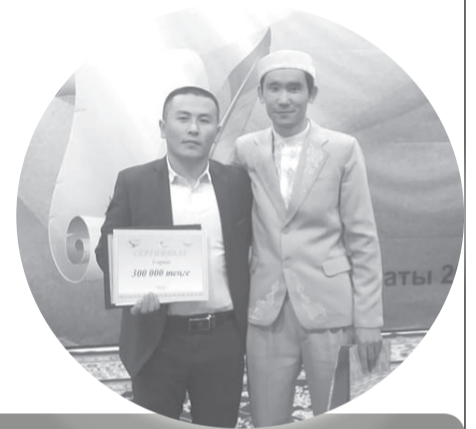
ОЛЖАМЕН ОРАЛҒАН АҚЫН