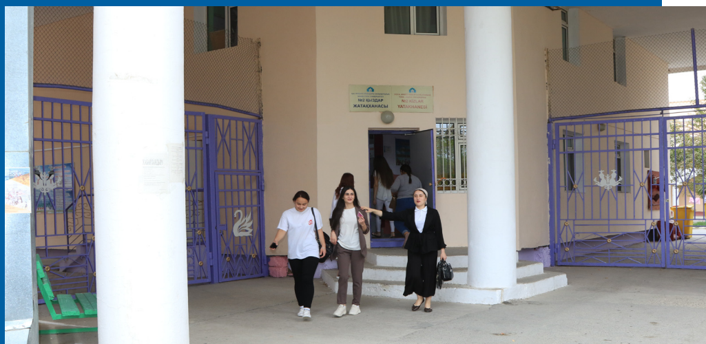
№ 2 ҚЫЗДАР ЖАТАҚХАНАСЫ