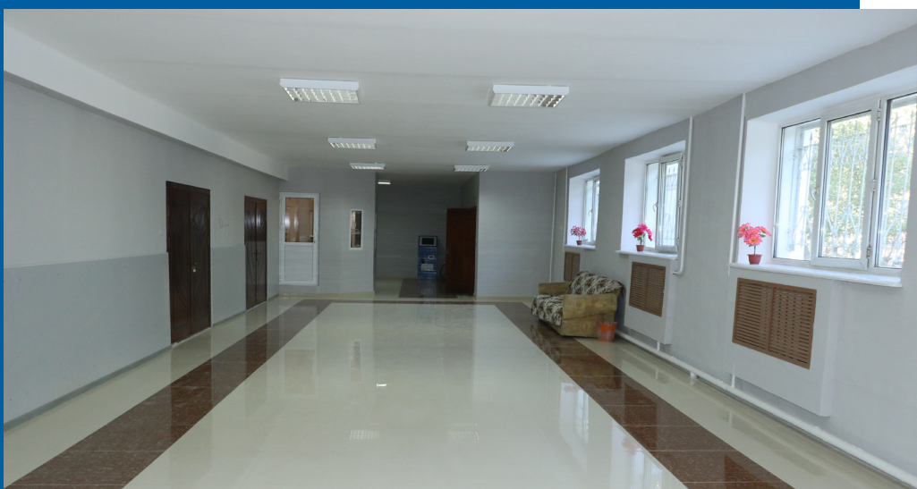
№ 3 ЖАТАҚХАНА