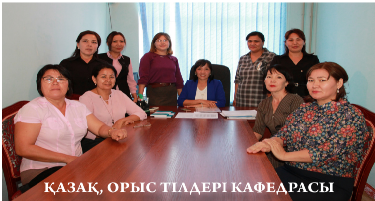
ҚАЗАҚ, ОРЫС ТІЛДЕРІ КАФЕДРАСЫ

Дайындық факультетінің тыңдаушылары, оқу жылында 3 түрлі топқа бөлінеді. Бірінші топ Түркия квотасындағы білім алушылар (ТК): бұл білім алушылар Қазақстан азаматтары, Түркия Республикасының шәкіртақысына ие. Екінші топ Түркі дүниесінен келген тыңдаушылар (ТД): бұл тыңдаушылар, әр түрлі мемлекеттерден және Түркі Мемлекеттерінен келеді және Қазақстан Республикасының шәкіртақысына ие. Түркі дүниесі үшін 200 грант бөлінеді. Үшінші топ Түркия Республикасынан келген тыңдаушылар; бұл тыңдаушылар Қазақстан Республикасының шәкіртақысына ие.