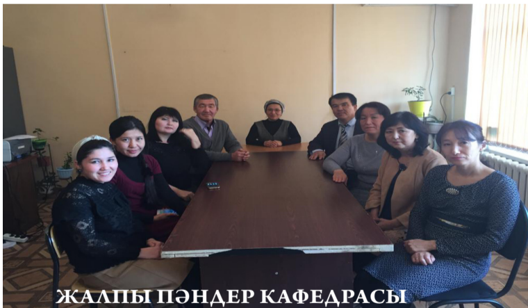
ЖАЛПЫ ПӘНДЕР КАФЕДРАСЫ

Қазақ, орыс тілдері кафедрасы Түркия Республикасы және Түркі тілдес мемлекеттер мен туыстас қауымдастықтардан келген тыңдаушыларға қазақ тілін үйретеді. Кафедра 2003 жылдың 1 қыркүйегінде Қазақ, орыс және ағылшын тілдері кафедрасы болып ашылған. 2015 жылдың қыркүйек айынан бастап кафедраның атауы Қазақ, орыс тілдері кафедрасы болып өзгертілді. Кафедра мамандық дайындамайды.