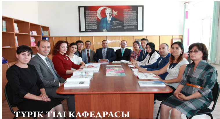
ТҮРК ТІЛІ КАФЕДРАСЫ

Түрік тілі кафедрасы - Түркі тілдес мемлекеттер мен туыстас қауымдастықтан келген тыңдаушыларға түрік тілін үйретеді. Университет құрылған жылдары Тіл үйрету орталығының құрамында болды. Кафедра мамандық дайындамайды. Кафедрада түрік тілінен арнайы дайындалған біліктілік білім емтиханынан жеткілікті ұпай жинаған білікті оқытушылар дәріс береді. Студенттерге тілді үйретудегі әдіс-тәсілдері, методикасы оқытылады.