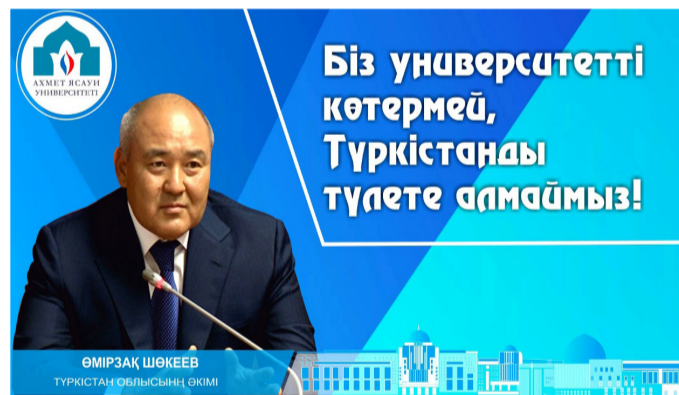
ТҮРКІСТАН ОБЛЫСЫНЫҢ ӘКІМІ Ө.ШӨКЕЕВ