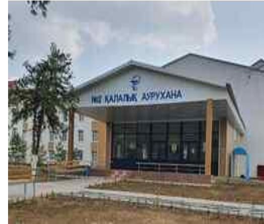
№2 қалалық аурухана