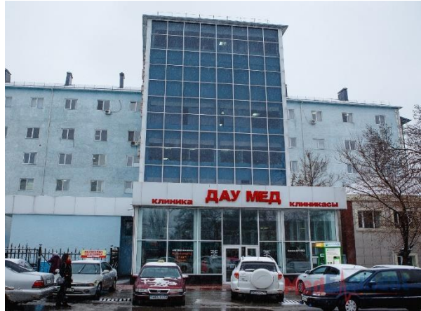
«Дау Мед» клиникасы