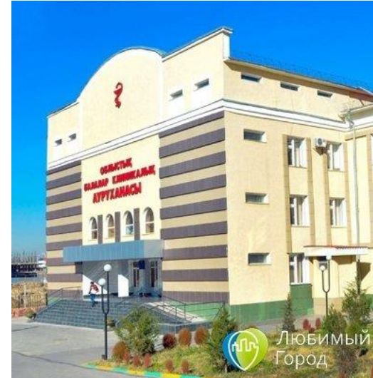
Облыстық балалар клиникалық ауруханасы