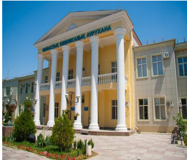
Облыстық клиникалық аурухана