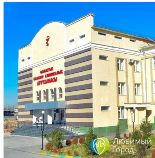
Облыстық балалар клиникалық ауруханасы