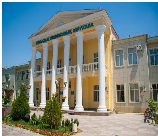
Облыстық клиникалық аурухана