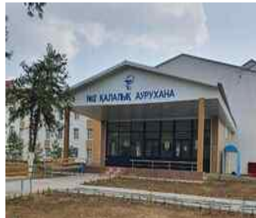
№2 қалалық аурухана