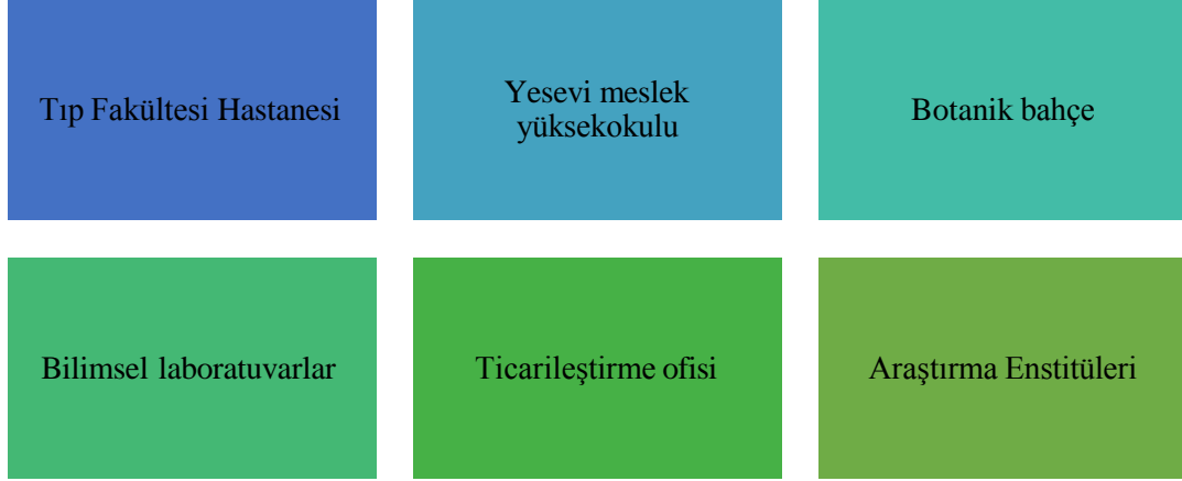
Şekil 4 – Ahmet Yesevi Üniversitesi'nin inovasyon ekosistemi

Genel olarak üniversite, inovasyonun verimli üretilmesi için bilimsel ve yenilikçi bir ekosistem oluşturur (Şekil 4).