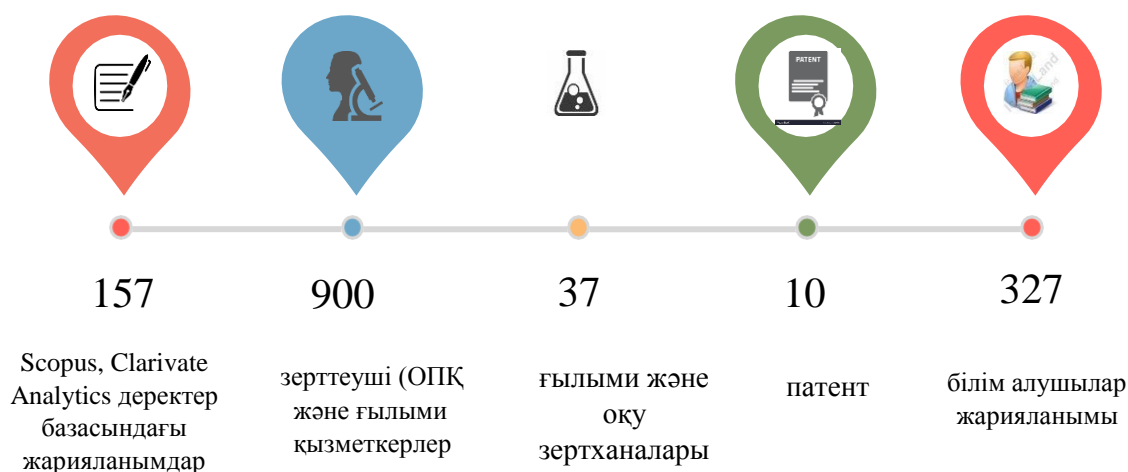
3-сурет – Ахмет Ясауи университетінің жетістіктері (2023ж.) (цифрлармен)

Ахмет Ясауи университетінің ғылыми-зерттеу және инновациялық қызметі білім, ғылым және инновацияны одан әрі интеграциялауға негізделген. Университет ғалымдары түркология, археология, дінтану, тарих, экономика, математика, физика, ақпараттық технологиялар, экология, электр энергетикасы, биотехнология, медицина және т.б. салаларда зерттеулер жүргізеді. Университеттің ғылыми портфолиосы 3-суретте көрсетілген.