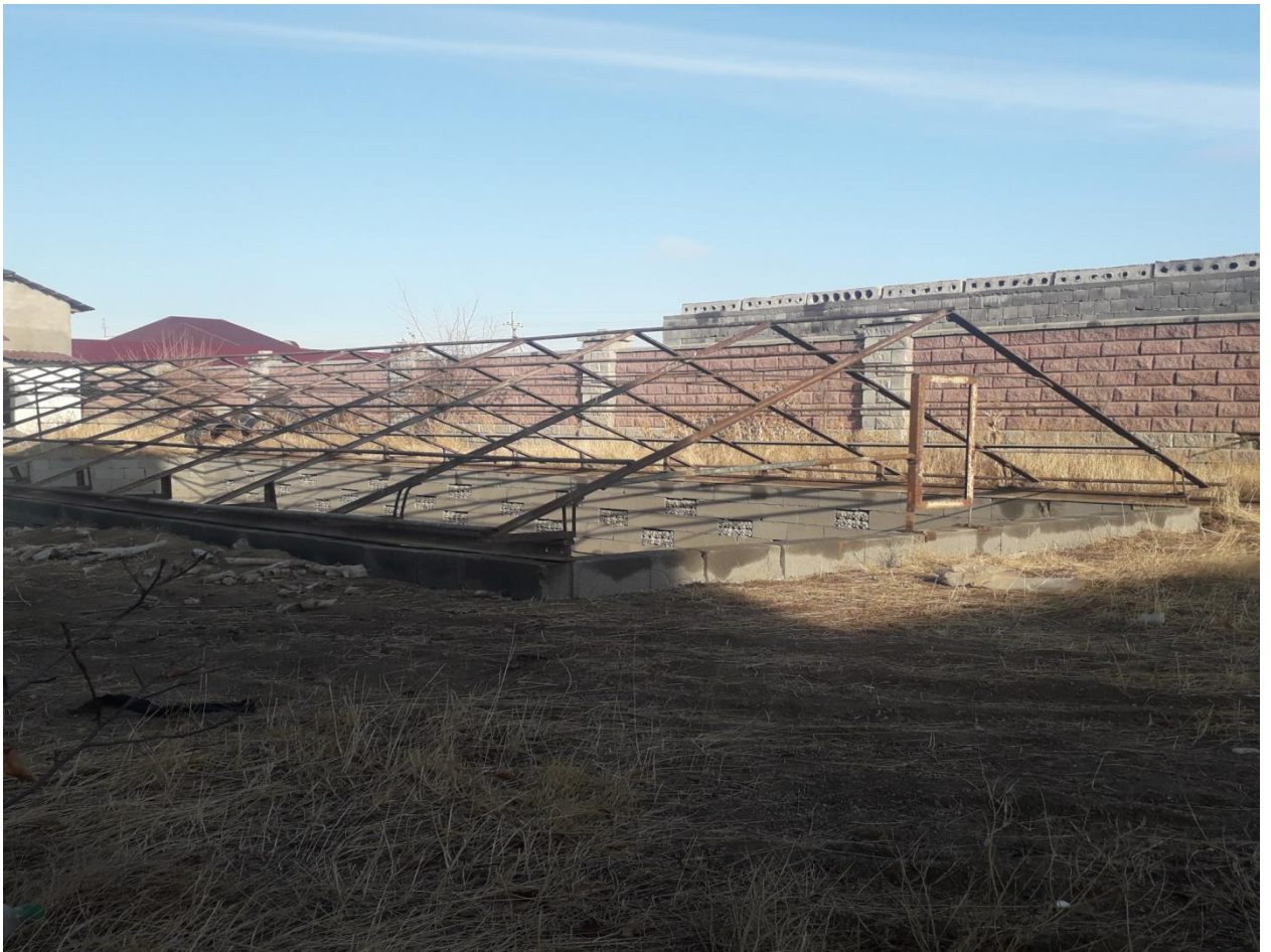
Опытно - полевое испытания органо-минерального удобрения мелиоранта