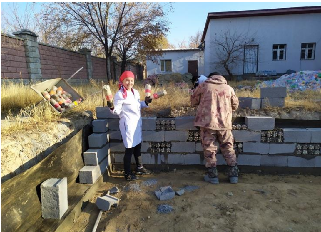
Укладка стен теплицы с использованием ТБО и производственных ОТХОДОВ